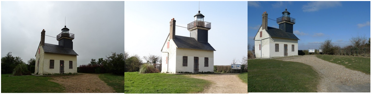
Vue sur le monument