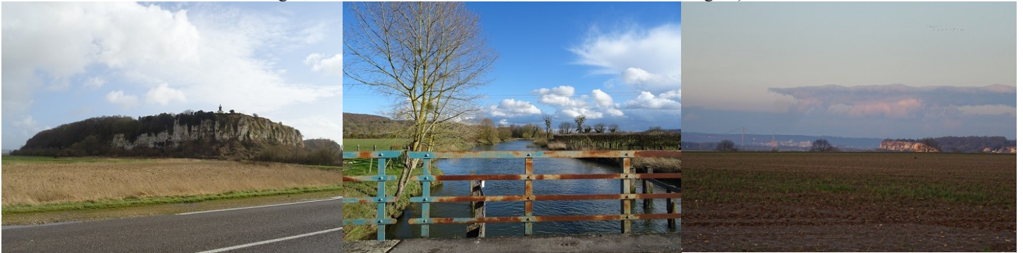
Vue des abords

Les avis seront cohérents avec ceux émis ces dernières années, à savoir : pas de maisons à volume compliqué (type V, W, Y, ou Z), pentes à 45° pour les volumes principaux, ardoise ou tuile plate de teinte brun vieilli, à 20u/m 2 , avec un débord de toiture de 20cm, enduit de teinte beige clair avec modénatures (au choix : chaînages, encadrement de fenêtres, soubassement, colombage...). *Voir les autres fiches.